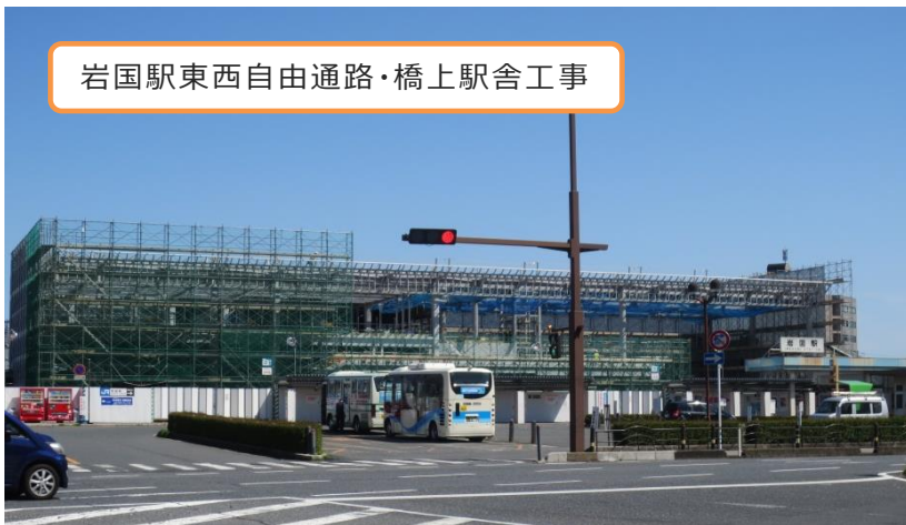
岩国駅東西自由通路・橋上駅舎の供用開始目標は今年度末です。